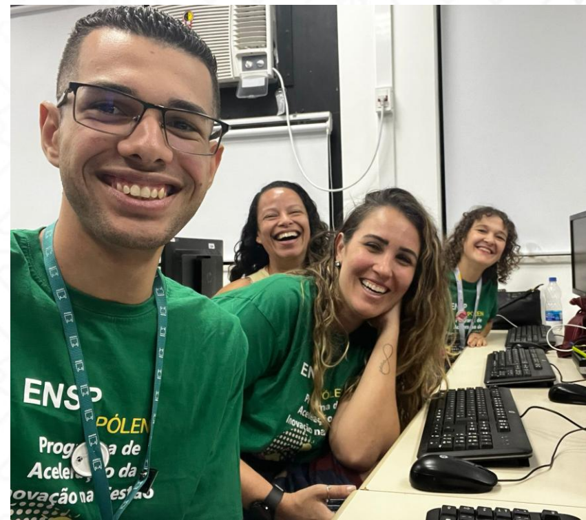
Grupo da CGE que está participando do programa de aceleração da inovação em gestão ofertada pelo Polen